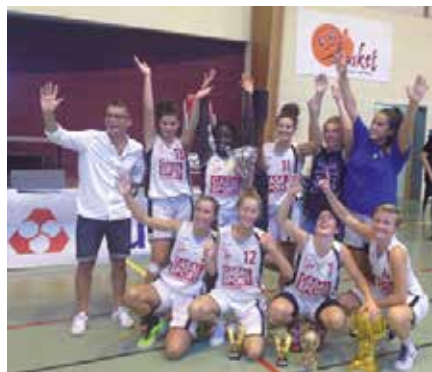
CTC Estuaire, vainqueur du tournoi

Félicitations à tous les participants et aux organisateurs du tournoi.